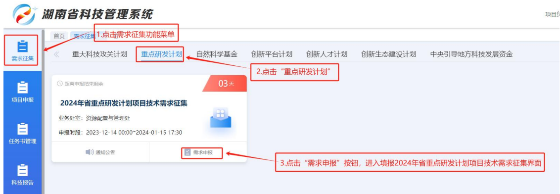
图 7 申报人员需求征集填报入口界面-“重点研发计划项目”