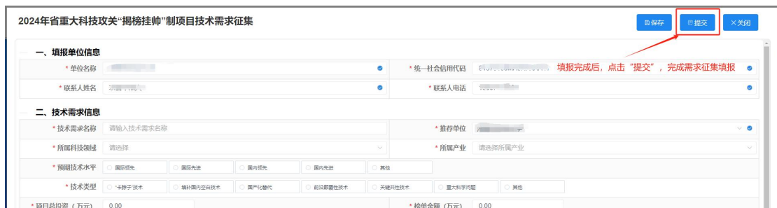
图 8 需求征集提交界面