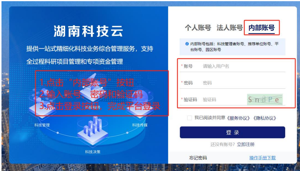
图 9 推荐单位需求征集登录界面