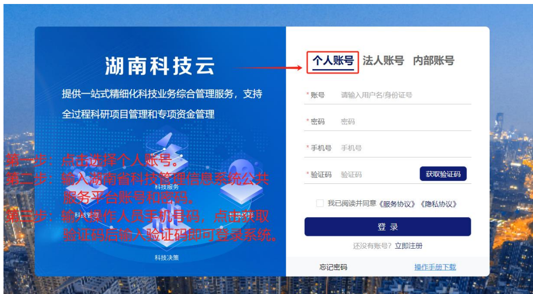
图 1 申报人员填报需求征集登录界面

1. 通过湖南省科学技术厅官网（ https://kjt.hunan.gov.cn/ ）—政务服务栏目—登录湖南科技云平台或者通过输入 http://61.187.87.50/main 网址直接进入科技云平台，使用湖南省科技管理信息系统公共服务平台账号和密码，登录后进入“科技项目管理系统”。如图 1 和图 2 所示：