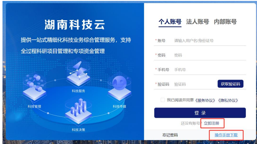
图 3 用户注册及操作手册（注册登录）下载

2. 如没有湖南省科技管理信息系统公共服务平台账号，请点击“立即注册”按钮进行项目申报人账号注册，注册操作步骤请详见“操作手册-注册登录”，如下图 3 所示。