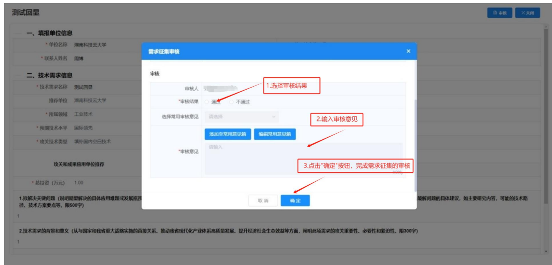
图 13 需求征集审核界面