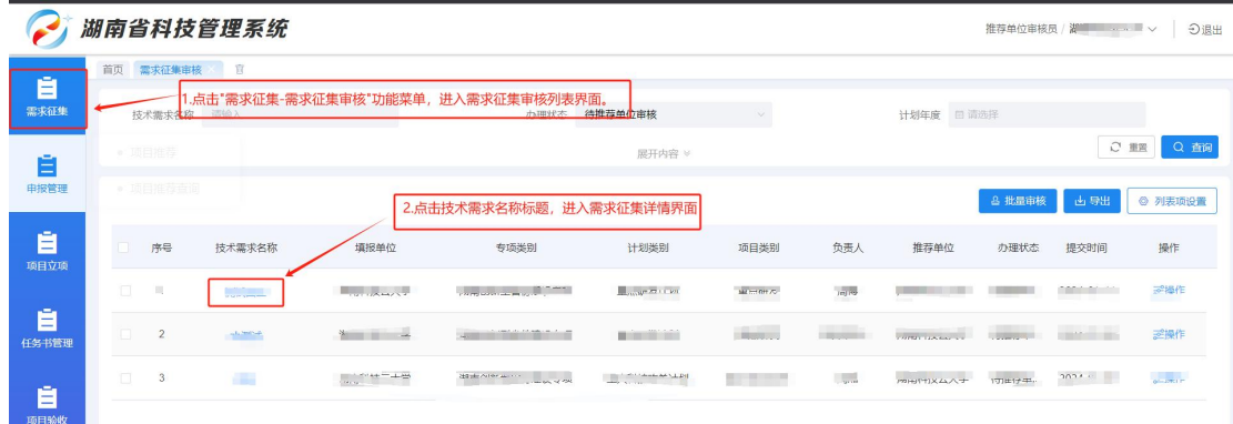
图 11 需求征集审核列表