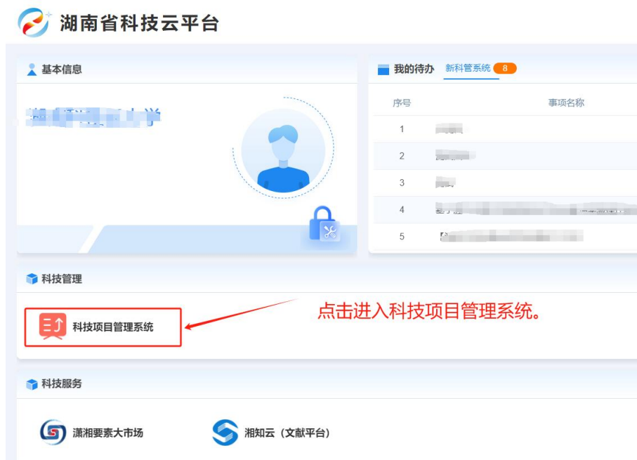
图 2 科技云平台内门户界面