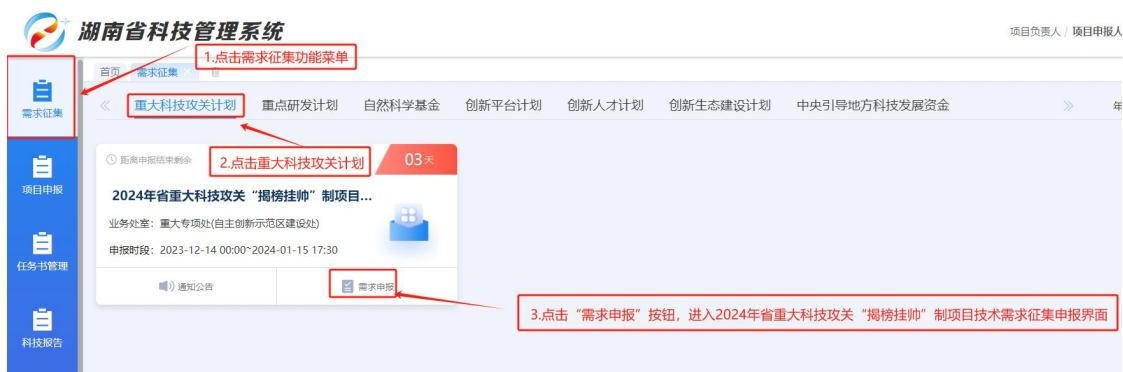
图 5 申报人员需求征集填报入口界面-“揭榜挂帅”