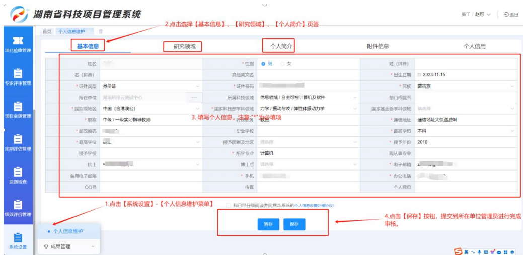
图 4 个人维护信息界面

点击左侧“系统设置”-“个人信息维护”功能菜单，进入个人信息维护界面，点击选择“基本信息/研究领域/个人简介”页签填写个人信息，填写完成后点击“保存”按钮提交到单位管理员进行审核。注意：需要单位管理员审核通过后才能进行需求填报，请及时联系所在单位管理员。如下图 4 所示。